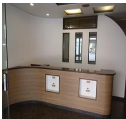
ラヴィーヌ福中 1階店舗