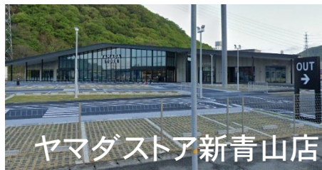
ヤマダストア新青山店