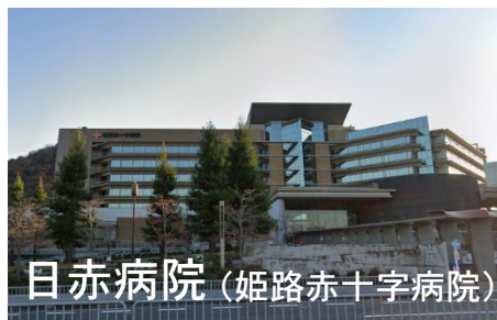
日赤病院 (姫路赤十字病院)