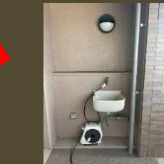
バルコニーには スロップシンクが ベランダガーデニング も楽しめますね