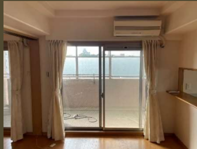
西側のリビングから姫路城を楽しめます