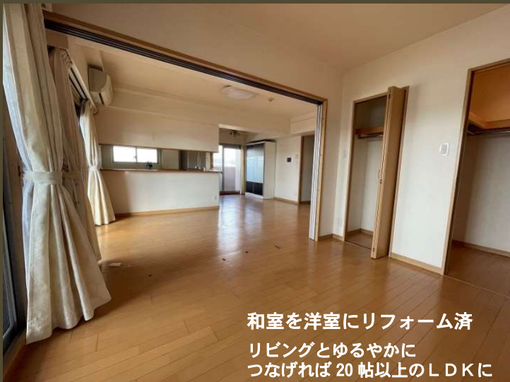
和室を洋室にリフォーム済 リビングとゆるやかに つなげれば 20 帖以上のLDKに