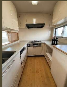
大理石天板のひろびろU字型キッチン

バスルームは 1418 サイズの 大きな浴槽 窓つきで 明るく 風通しも良く 爽やかです